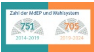
Grafik: EPRS | Wissenschaftlicher Dienst des Europäischen Parlaments, Oktober 2018

Nach dem Austritt Großbritanniens aus der EU am 31. Januar 2020 wird die Zahl der