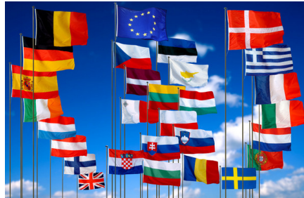
Flaggen der Mitgliedsstaaten.