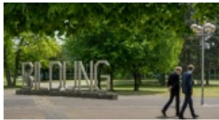
Bildung. Quelle: Flickr/ Simon Bierwald; CC-BY-2.0.

Zur Bildlizenz ( https://creativecommons.org/licenses/by-sa/2.0/ ). Zum Originalbild. ( https://flic.kr/p/wywbAG )