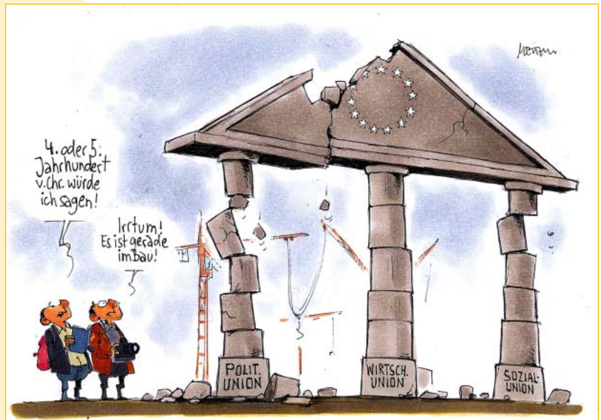
Abb. 1 »Europas Säulen«

Die Aufgabe der eigenen Währung ist ein Verzicht auf einen erheblichen Teil an nationaler Souveränität. Warum haben sich so viele Staaten der Europäischen Union entschieden, ihre nationa-