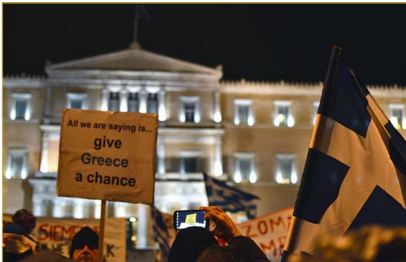
Abb. 3 »Großdemonstration vor dem griechischen Parlament in Athen im Jahr 2015 gegen die Austeritäts- bzw. Sparpolitik, die die europäischen Kreditgeber EZB und EU von der griechischen Regierung verlangt«

Die Wirtschaftsleistung, die im Lauf der 1990er Jahre solide gewachsen war, zog zu Beginn des neuen Jahrhunderts deutlich an. Mit einem durchschnittlichen Wachstum von 4 Prozent pro Jahr gehörte Griechenland zwischen 2000 und 2005 zu den am schnellsten wachsenden Volkswirtschaften im gesamten Euro-Raum. Die Lücke zu den reicheren Ländern in Europa schien sich rasch zu schließen, zumal eine Revision der Daten des Bruttoinlandsprodukts im Jahr 2006 (zur Anpassung an europäische Regeln) dieses zusätzlich nach oben korrigierte. Die Erhöhung wurde auf das Wachstum des Dienstleistungssektors zurückgeführt, auf Liberalisierungen bei der Produkt- und Finanzmarktregulierung sowie auf eine erhebliche Reduzierung der Kreditkosten durch den Beitritt zur europäischen Währungsunion. Probleme gab es allerdings durch eine erheblich über dem Durchschnitt der Euro-Länder liegende Inflationsrate sowie sinkende internationale Wettbewerbsfähigkeit, die sich in stark steigenden Lohn-