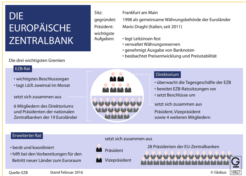
Abb. 2 »Die Europäische Zentralbank«

In der Bundesrepublik Deutschland war die Unterstützung für die Einführung der gemeinsamen Währung über praktisch das gesamte politische Spektrum stark gewesen. Von einzelnen abweichenden Stimmen abgesehen war man sich einig, dass die Stabilität einer gemeinsamen Währung sowie die Orientierung der Europäischen Zentralbank an der Funktionsweise der Bundesbank eindeutig im deutschen Interesse war. Die Bundesbank selbst, den Abstieg von der dominanten geldpolitischen Kraft in Europa zur Filiale der neuen Zentralbank vor Augen, war in den Verhandlungen zwar zögerlich gewesen, jedoch letztlich nicht in der Lage, sich dem expliziten Willen der Regierung von Helmut Kohl zu widersetzen. Doch die wirtschaftliche Entwicklung nach