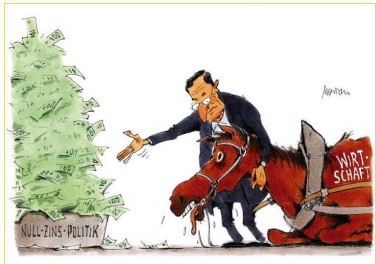
M 2 »EZB-Chef Mario Draghi: Greif zu!«

Deutschland als Ablehnung einer Transferunion (»no-bailout«) formuliert. Gravierender war aber, dass nicht einmal die elementaren Grundlagen der Währungsunion beachtet wurden. Insbesondere wurde übersehen, dass, wie bereits erwähnt, mit dem Eingehen der Währungsunion bereits ein Verzicht auf nationale Souveränität geleistet wurde, nämlich das Recht auf eine eigenständige Geldpolitik. Dies mag den Wirtschaftspolitikern in den Mitgliedstaaten noch bewusst gewesen sein, aber offenkundig nicht, in welcher Weise sich damit ihr Handlungsspielraum veränderte. Denn entweder musste man sich dann auch auf nationaler Ebene an das gemeinsame Inflationsziel halten oder aber doch eine flankierende und kompensierende europäische Finanzpolitik akzeptieren. Letzteres war wegen der Ablehnung einer Transferunion nicht gewollt, ersteres wurde nicht gesehen. Folglich wurden die Gefahren vernachlässigt, die sich für die Stabilität des Euroraums aus den divergierenden Inflationsraten ergaben. Abweichende Inflationsraten bedeuten, dass die Volkswirtschaften durch reale Aufwertungen, wenn ihre Inflationsraten relativ hoch sind, beziehungsweise reale Abwertungen, wenn sie relativ niedrig sind, ihre Wettbewerbsposition verändern. Erstere verlieren, und ihre Leistungsbilanz wird nach einiger Zeit negativ. Letztere gewinnen und erzielen auf längere Sicht Überschüsse im Außen-