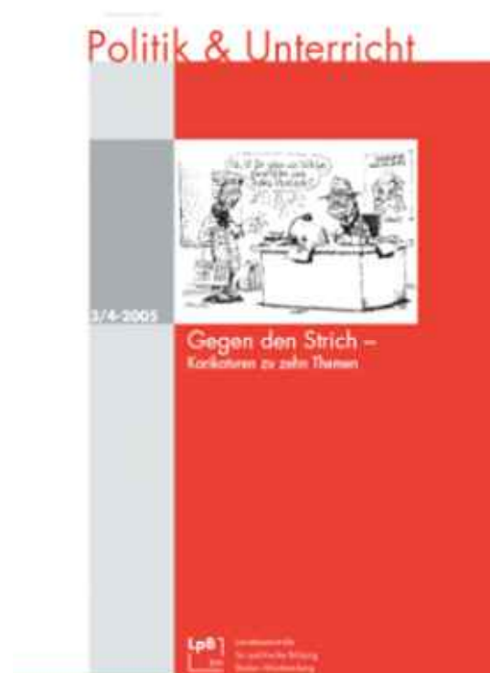
Politik & Unterricht Gegen den Strich Karikaturen zu zehn Themen Heft 3/4-2005 Download