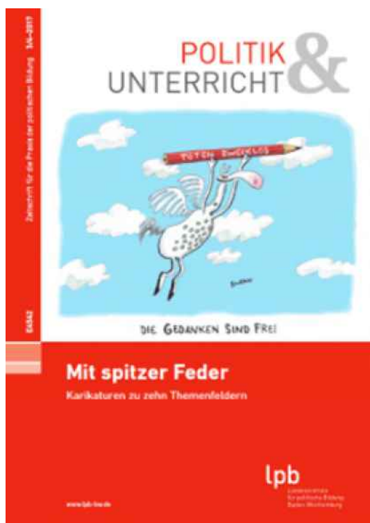
Politik & Unterricht Mit spitzer Feder Karikaturen zu zehn Themenfeldern Heft 3/4-2017 Download