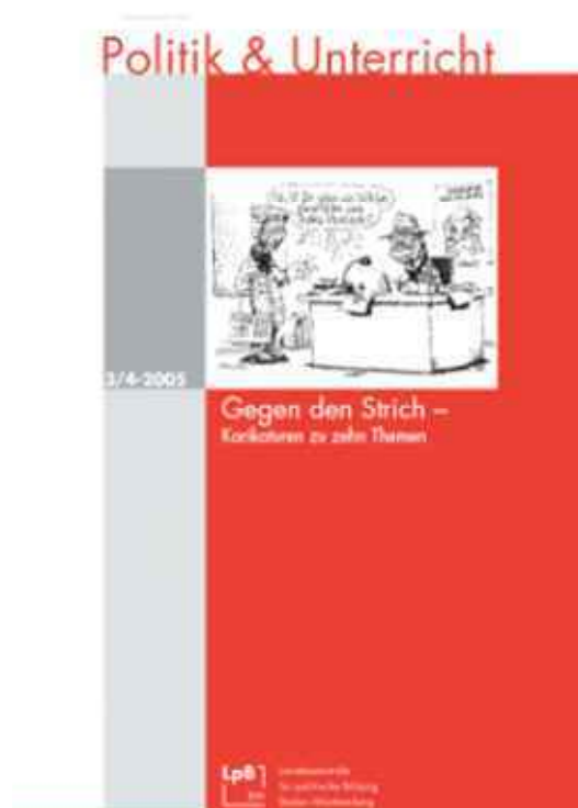
Politik & Unterricht Gegen den Strich Karikaturen zu zehn Themen Heft 3/4-2005 Download