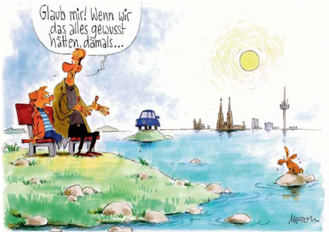
Karikatur 2: Klimaflucht © Gerhard Mester, 2015