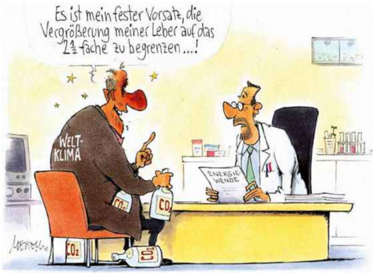
Karikatur 4: Ignoranz. © Gerhard Mester, 2012